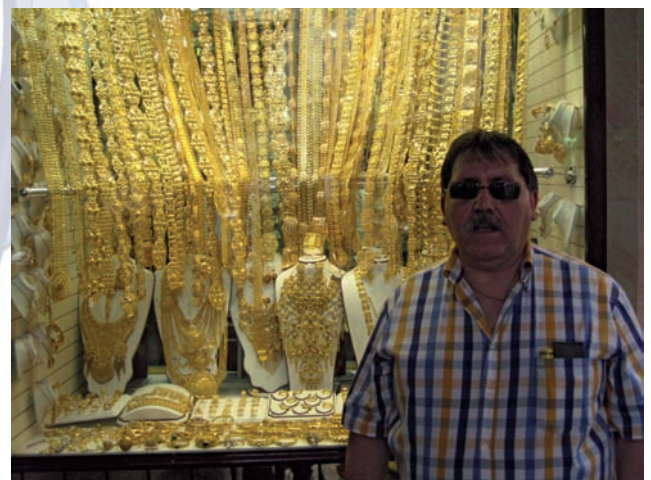
■ Una tienda de oro en Dubai

Por supuesto. He hecho viajes de todo tipo, incluso en una ocasión sin dinero porque me atracaron en Barajas al ir a