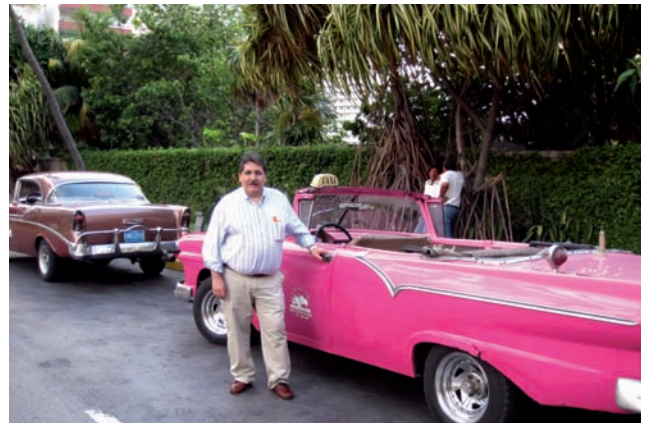
■ En los “modelos” de la Habana

Teheran y otras capitales de Irán presentan excepcionales atractivos pero también dificultades. El farsi es su lengua materna y hay muy pocas personas que hablen inglés y, por supuesto, ninguna habla español. Un día festivo que salí solo a la calle tuve que programar con el personal del hotel y un taxista todo el itinerario de la jornada. Mi consejo es que se tomen medidas de precaución, que no se haga ostentación de nada y que se deje en el hotel la matrícula del coche en el que viajas.