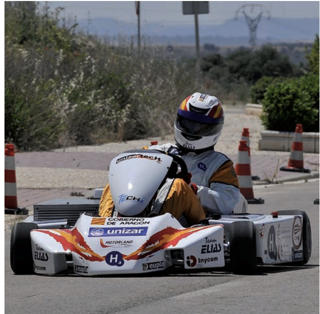
El bólido, accionado por pila de combustible de hidrógeno

Uno de esos proyectos de investigación es el llamado Fórmula Zero, que consiste en la concepción, diseño y fabricación de un kart propulsado por pila de combustible de hidrógeno que competirá en el campeonato internacional del mismo nombre. El vehículo pretende acercar el conocimiento del hidrógeno al gran público y ha sido desarrollado por el equipo EuplaTech2 que integran la Fundación del Hidrógeno, la Escuela Universitaria Politécnica de La Almunia de Doña Godina y el equipo de competición de automovilismo Team Elías.