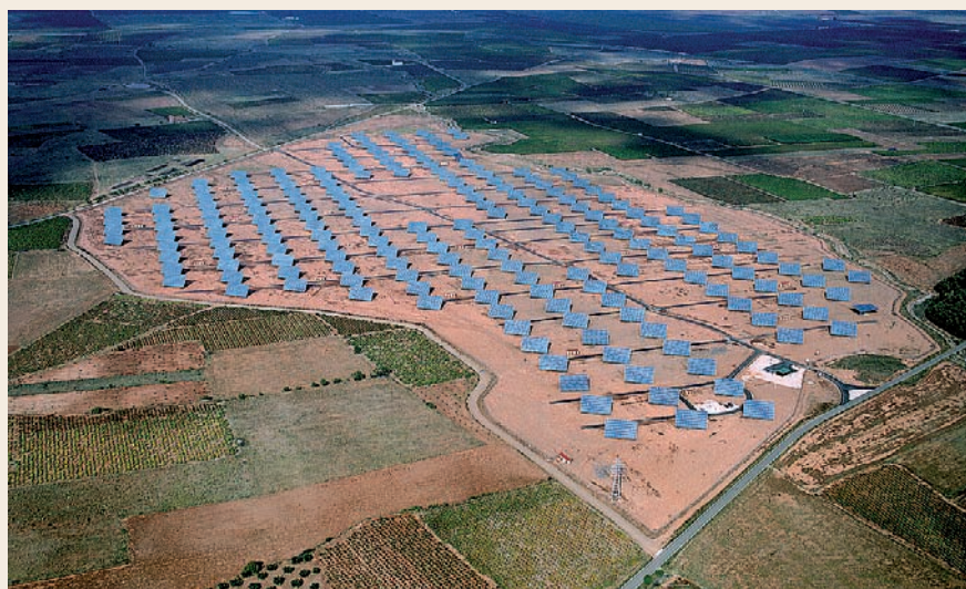
■ Parque Fotovoltaico de Almonacid de la Sierra

Nadie pone en duda de que Aragón es una comunidad con decidida vocación por las energías renovables. Una aptitud que no sólo se manifiesta en el montante de producción por distintos sistemas, sino por el dominio de las tecnologías de instalación. Una muestra de esta disposición es el nuevo Parque Fotovoltaico construido en Almonacid de la Sierra, que ocupa una extensión de 50 hectáreas y que genera electricidad capaz de abastecer a 3.600 hogares. Su construcción ha sido de responsabilidad exclusiva de empresas aragonesas. El impulso promotor es de la empresa Pagola S.A. mientras que el diseño y dirección de obra ha corrido a cargo de la firma aragonesa de ingeniería Sisener. La obra civil fue contratada a APO (Aragonesa de Proyectos y Obras) y, finalmente, MAETEL, S.A., empresa aragonesa del Grupo Industrial SEMI-MAESSA, ha llevado a cabo la realización del proyecto "llaves en mano", desarrollando la ingeniería de detalle, suministro, construcción, puesta en marcha y posterior mantenimiento.