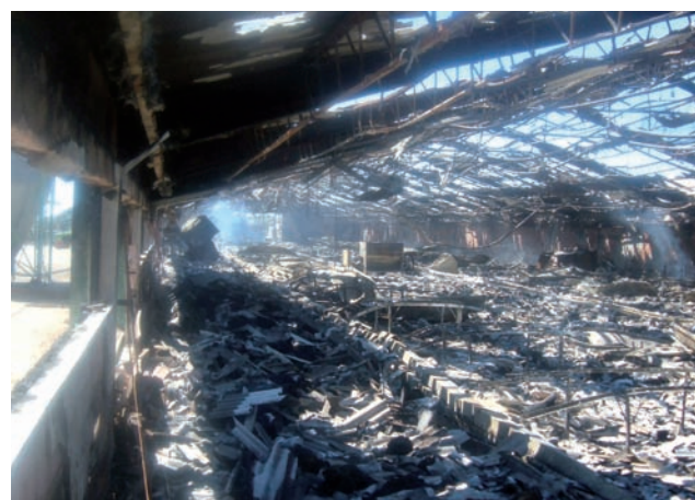
Colaboración Técnica: AXA Seguros

La segunda pregunta es esta: ¿ha agravado el siniestro la enorme acumulación de mercancía existente y la dificultad de movimiento que significaba?. Quizás la respuesta merece una reflexión más amplia. El interrogante nos lleva a hacer hincapié en un aspecto básico: un almacenamiento de material fácilmente combustible, distribuido de forma que alcanza los 5'5 metros de altura (en un edificio de 6 m.) y que presenta pasillos de separación insuficientes entre pilas, hace difícil un ataque eficaz y efectivo contra el fuego con medios de extinción manuales. La dificultad de acceso a esos medios suele ser el primer problema.