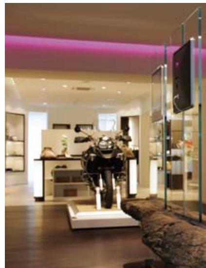
■ Otros espacios de la "Casa de las marcas"