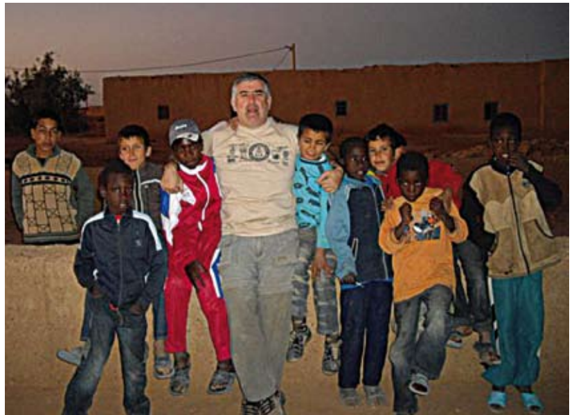
■ Poblado bereber de Merzouga (Marrakech)

Las dunas han sido para ti un espacio de entrenamiento que se ha convertido también en un escenario para tu actividad como cooperante. Háblanos de ello.