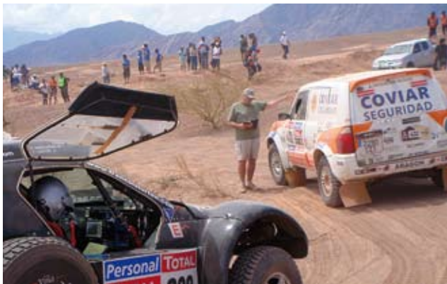
■ Salida de la Etapa: La Rioja-Fiambala