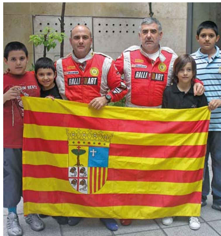
■ Con descendientes de Aragón, minutos antes de la salida de la 1ª Etapa del Dakar 2010