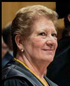
Entrevista: CONCHA FERRER, presidenta del Colegio de Médicos de Zaragoza Entrevista