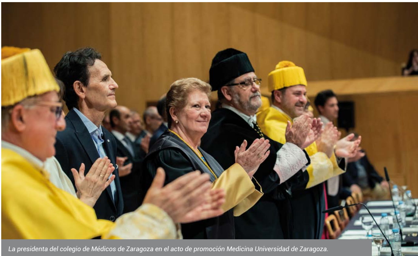
La presidenta del colegio de Médicos de Zaragoza en el acto de promoción Medicina Universidad de Zaragoza.

Por supuesto. De hecho, ahora ya muchas empresas están preparándose para que tengamos aquí también líneas de fabricación. En cualquier caso, la conclusión es clara: hay que potenciar la Salud Pública, porque ha fallado estrepitosamente en esta pandemia. Ha tenido mucho que ver la falta de presupuesto, pero también la falta de coordinación entre estamentos sanitarios. Máxime, cuando se trata de cuestiones virológicas. En los propios hospitales, los médicos se agruparon para formar a compañeros de otras especialidades para que adquiriesen conocimientos para hacer frente a la covid-19. Los anestelistas se transformaron en intensivistas. Los de digestivo aprendieron nociones de respiratorio. Esta capacidad de adaptación al entorno del colectivo sanitario es lo que realmente ha salvado al sistema. A pesar de nuestras cifras, ellos han evitado que saliéramos peor parados.