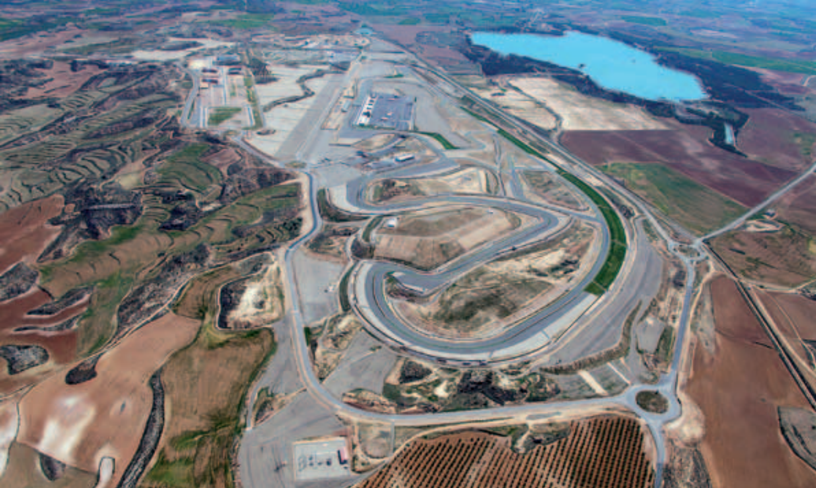
■ Circuito de Motorland, en Alcañiz.

dos. El cluster desempeña la labor de orientación hacia la innovación y los nuevos mercados. Los mercados son el fundamento de la economía ya que son los que tienen el dinero y los distintos sectores deben producir lo que el mercado demanda.