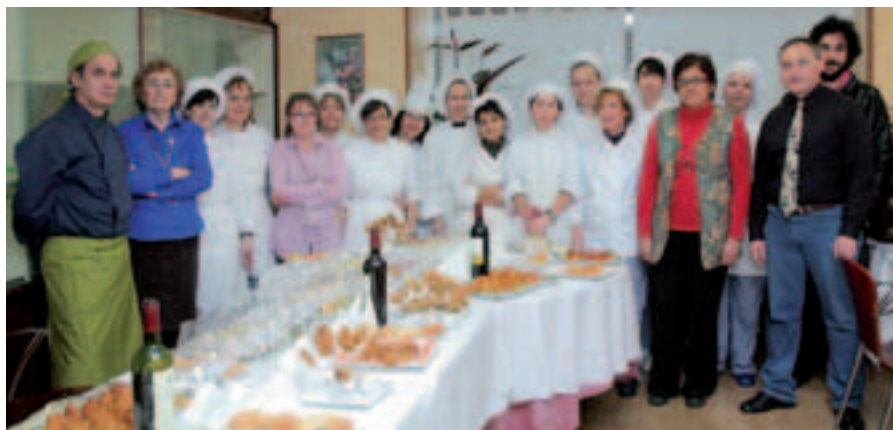
■ Curso en el centro de formación de HORECA.

Desde su creación, Horeca Restaurantes ha prestado especial atención a la promoción de la gastronomía zaragozana. En esta línea se encuentran actividades como el anual Certamen Gastronómico de Zaragoza y provincia que acaba de celebrar su 13ª edición con un incremento anual de establecimientos que participan en el certamen.