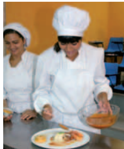
■ Curso para ayudantes de cocina.

orientadas a la promoción de los restaurantes de Zaragoza y provincia. Así, Horeca cuida la actualización continua de los datos de los restaurantes de Zaragoza en las distintas guías de gastronomía y hace ediciones anuales de publicaciones como “Guía Comer en Zaragoza”, “Zaragoza y sus cocineros” y el propio recetario del “Certamen Gastronómico.