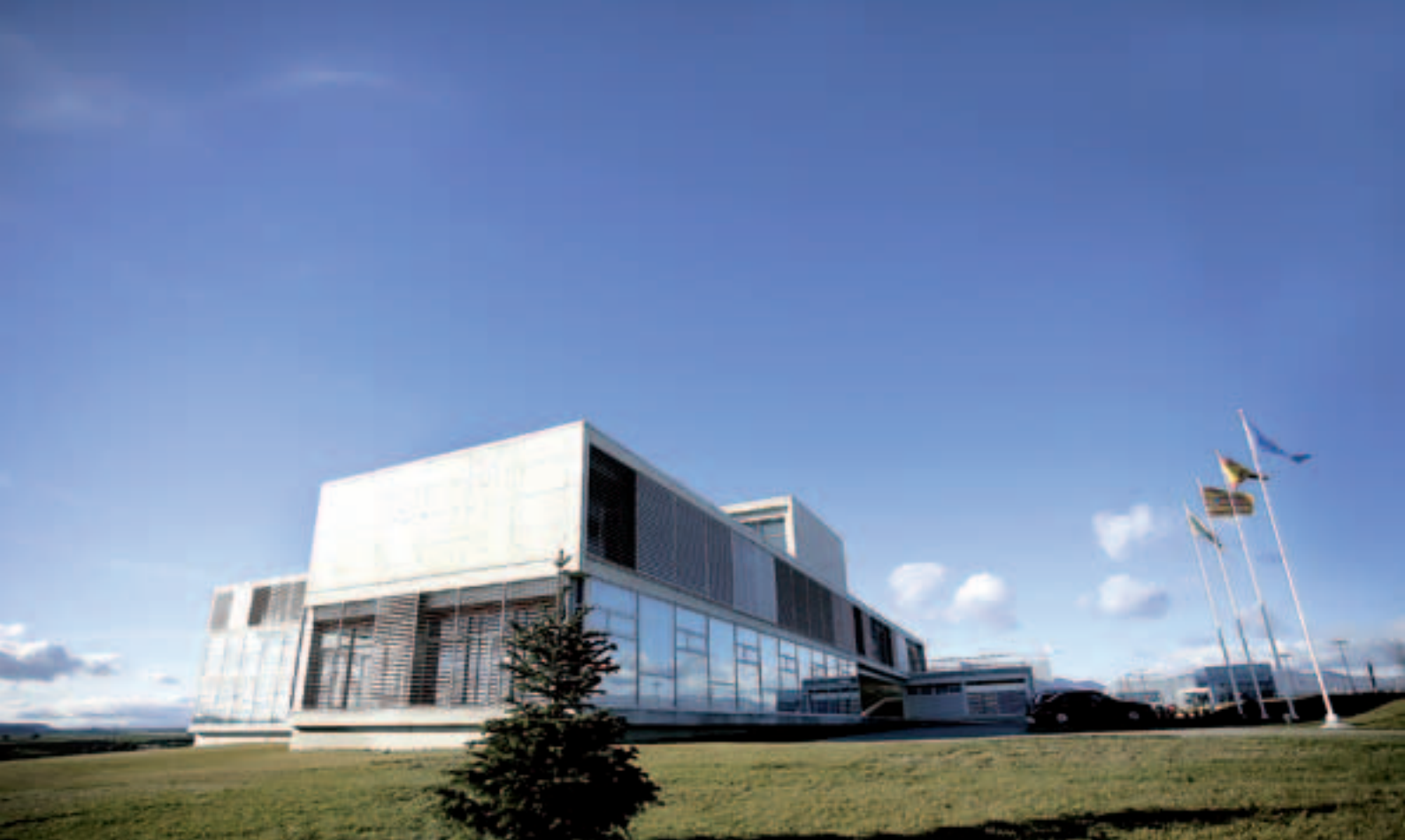
■ Parque Tecnológico Walqa, en Huesca.

gran futuro. La demanda de alimentos es creciente en el mundo y la producción de alimentos a precios competitivos tiene asegurada su colocación en los mercados. Además, este sector agroalimentario es difícilmente deslocalizable. Creo que es una actividad en la que debemos volcarnos. Ya lo hicimos hace una década cuando el IAF entró en el sector vitivinícola, creando con las cooperativas de las denominaciones de origen importantes negocios de producción de vino. Con el desarrollo de nuevas bodegas, el sector ha experimentando en Aragón una cifra de producción creciente y hoy exporta el 60 por ciento de su producción total.